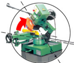
45° links diagonale Schnitte

Mikrosprühnebel-Vorrichtung Lade- und Entladerollbahn