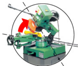
45° links diagonale Schnitte

Mikrosprühnebel-Vorrichtung Spanndruckregler Lade- und Entladerollbahn